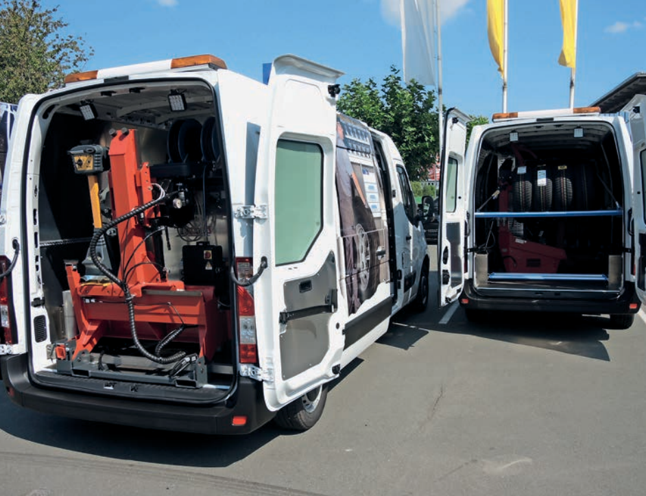
Zwei Pannenhilfsfahrzeuge für Lkw und Pkw-Einsätze (r.)