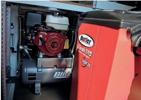
Der Blitz-Kompressor für die Pkw-Pannenhilfe

Beide Fahrzeuge lassen sich mit dem Führerschein Klasse B fahren.