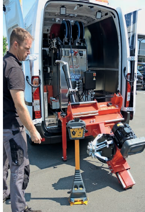
Die Haweka-Montagemaschine ist einsatzfähig.